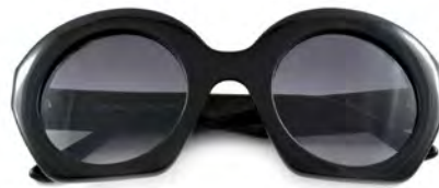
ANDY WOLFF BLUEBELL € 336

Dit jaar zijn grote, vierkante zonnebrillen helemaal in de mode. Door te kiezen voor een vierkant montuur, krijg je een retro uitstraling en creëer je een unieke look.