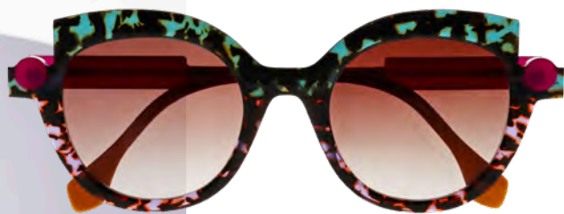
FACE A FACE SOTSAS € 325