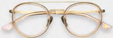
EINSTOFFEN ARTIST € 342