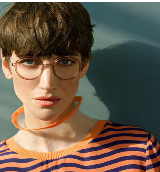
CHIMI 04 GREEN € 140