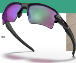
OAKLEY FLAK 2 € 180

Bezoek ons voor een persoonlijk advies en ontdek hoe een op maat gemaakte sportbril uw sportervaring kan transformeren. Maak een afspraak met onze specialisten voor een advies op maat.