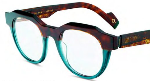
ETNIA JAVI € 263