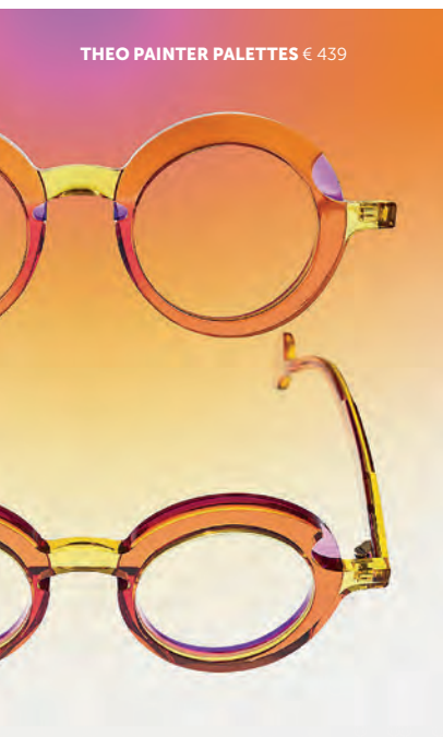
THEO PAINTER PALETTES € 439