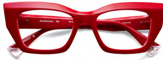
ETNIA POSIDONIA € 203