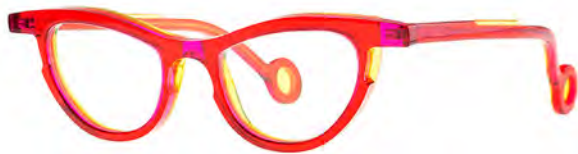
THEO PABLO € 439