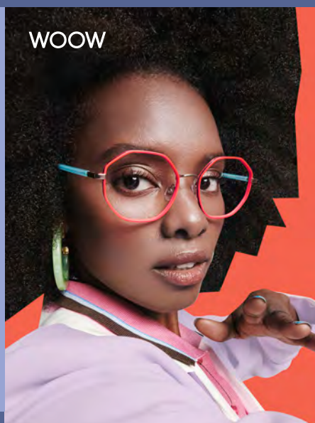
WOOW PLAYLIST 2 € 302

De terugkeer naar grootformaat brillen markeert een aanzienlijke verschuiving in de optische mode. Na jaren van fijnere silhouetten, verwelkomen we nu de majestueuze aanwezigheid van oversized monturen. Het slanke, bijna etherische frame, dat subtiel de contouren van de drager volgt, biedt een moderne interpretatie van deze klassieke stijl.