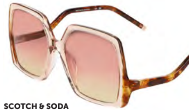
SCOTCH & SODA ROSELLA 247 € 150