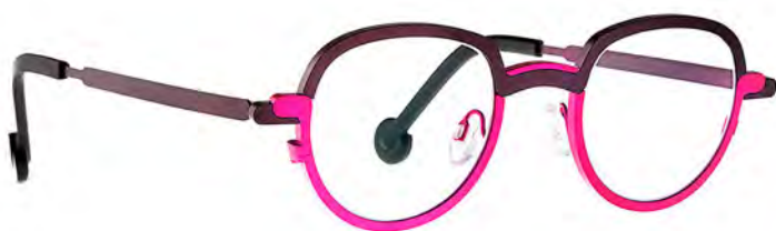
THEO MONG KOK € 517