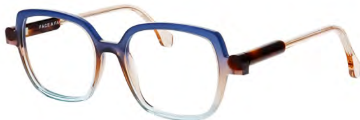
FACE A FACE KYOTO € 444

Stap binnen in de wereld van FACE A FACE bij Van Gestel Optiek en omarm de kunst van de Japanse esthetiek met een montuur dat even uniek is als u. Laat u inspireren door de creativiteit en durf die de kern vormen van onze filosofie. Welkom in een wereld waar uw bril niet alleen uw zicht verbetert, maar ook een statement maakt.