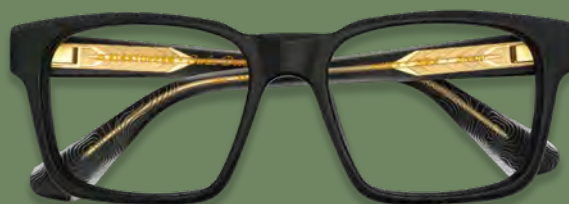
EINSTOFFEN BREMSER € 298

EINSTOFFEN staat symbool voor vrijheid en onafhankelijkheid, een filosofie die wij bij Van Gestel Optiek volledig omarmen. Sinds de oprichting in 2008 heeft EINSTOFFEN de conventies in de wereld van brillen en mode uitgedaagd, en zich gericht op het creëren voor diegenen met een vrije geest. Onze collecties zijn een ode aan de milieubewuste, levensgenietende individuen die waarde hechten aan Zwitserse kwaliteit en uniciteit. EINSTOFFEN's designs, rijk aan ongebruikelijke materialen en extravagante details, spreken tot de verbeelding en weerspiegelen de geest van avontuur. Ontdek bij Van Gestel hoe EINSTOFFEN de grenzen van traditionele mode en brillen ontwerpt, met collecties die even dynamisch en onvoorspelbaar zijn als het leven zelf.