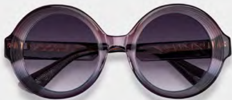
EINSTOFFEN COUTURIER € 234